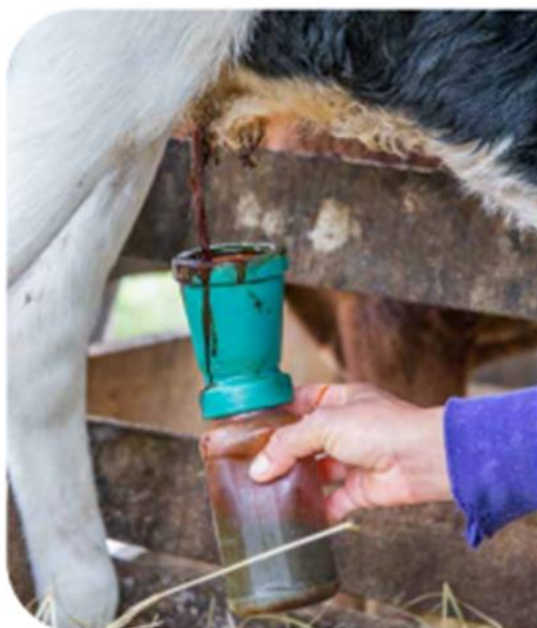
Figura 5 - Cura de umbigo com iodo

É preciso realizar a cura do umbigo do bezerro logo após o nascimento e verificar o comprimento do cordão umbilical. Segundo Gomes e Martins (2016), a cura do umbigo pode ser realizada com soluções antissépticas a base de iodo ou clorexidina. O mecanismo correto para a cura do umbigo é mergulhar o cordão na solução, conforme a Figura 5. A antisepsia do cordão umbilical deve ser realizada de duas a três vezes ao dia durante os três primeiros dias de vida e posteriormente pode ser realizado diariamente.