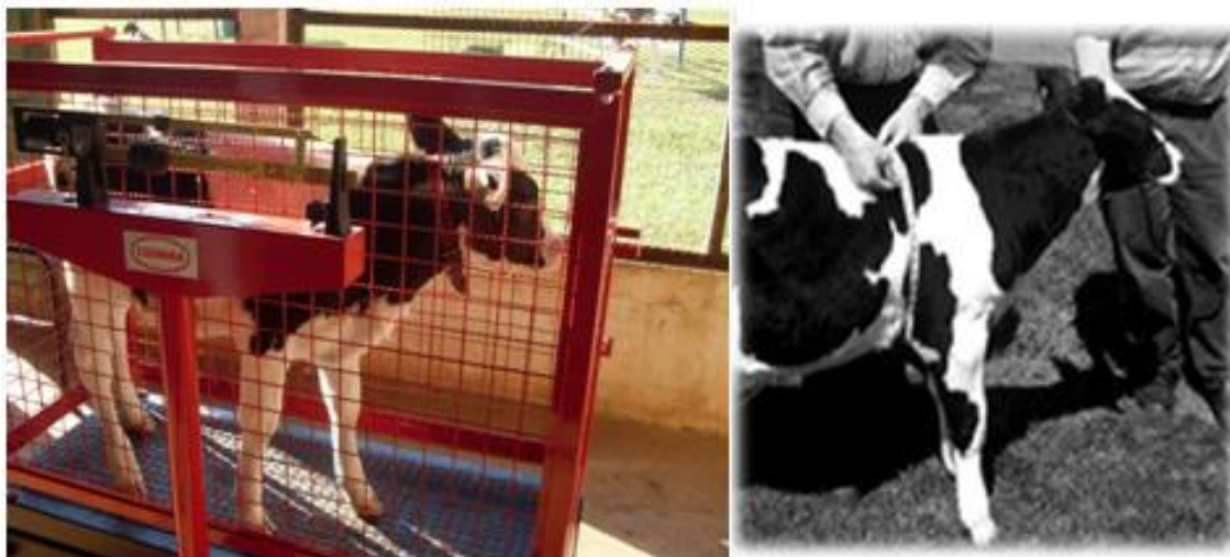
Figura 1 - Pesagem e medidas de perímetro torácico de animais de reposição