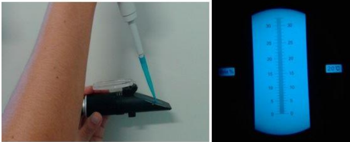
Figura 3 - Refratômetro de brix óptico. Refratômetro de brix óptico (imagem à esquerda). Escala interna do refratômetro, onde se avalia a qualidade do colostro (imagem à direita).

O fornecimento do colostro deve ser monitorado e de preferência que não deixe o recém-nascido mamar diretamente na mãe, pois a mesma possui sujidades nos tetos e isso pode causar doenças no bezerro. Segundo Bittar et al. (2018) quando o bezerro mama na vaca não se tem controle de quando e quanto mamou, assim como da qualidade do colostro consumido. O fornecimento pode ser feito de três formas distintas: pela mamadeira, balde ou por sonda esofágica. Os diferentes métodos de fornecimento de colostro estão apresentados na Figura 4.