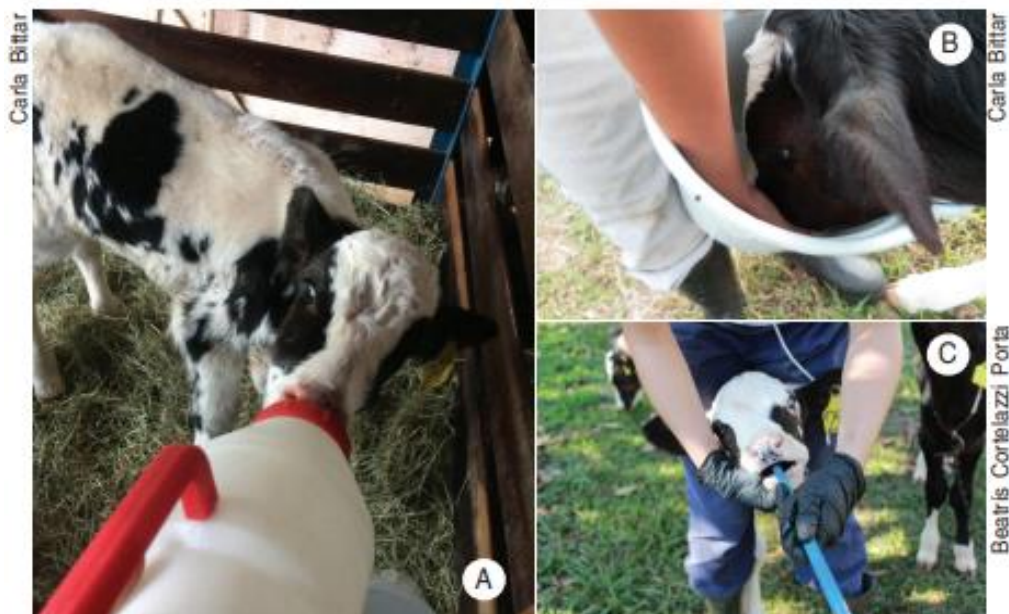
Figura 4 - Diferentes métodos de fornecimento de colostro. Mamadeira (A). Balde (B). Sonda esofágica (C). Fonte: Bittar et al. (2018, p. 24).

O fornecimento do colostro deve ser monitorado e de preferência que não deixe o recém-nascido mamar diretamente na mãe, pois a mesma possui sujidades nos tetos e isso pode causar doenças no bezerro. Segundo Bittar et al. (2018) quando o bezerro mama na vaca não se tem controle de quando e quanto mamou, assim como da qualidade do colostro consumido. O fornecimento pode ser feito de três formas distintas: pela mamadeira, balde ou por sonda esofágica. Os diferentes métodos de fornecimento de colostro estão apresentados na Figura 4.